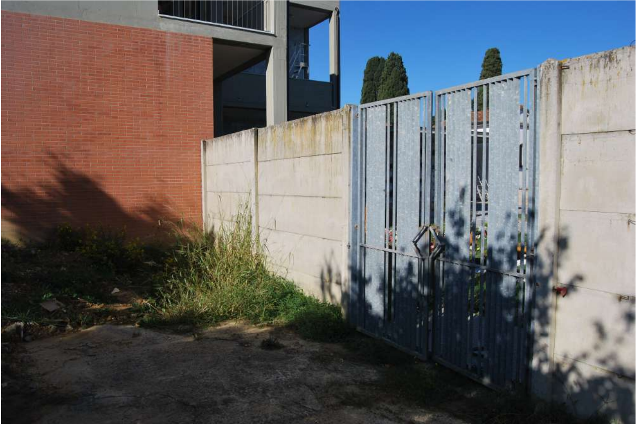
Foto 17: Il muro in cui verrà realizzato il passaggio fra parte nuova e futuro ampliamento