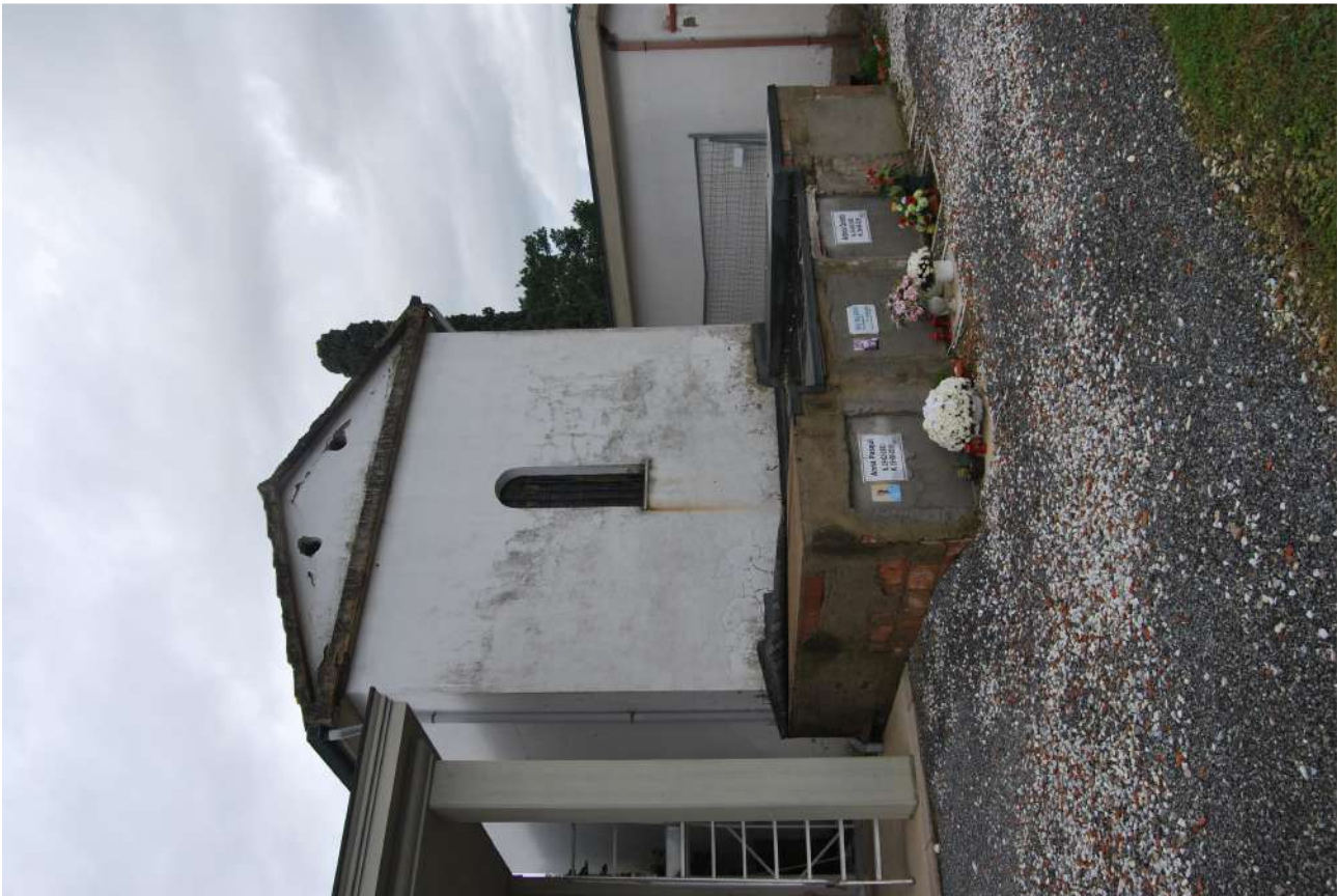
Foto 19: La superfetazione dei loculi addossati alla cappella Carli da demolire al verificarsi delle condizioni