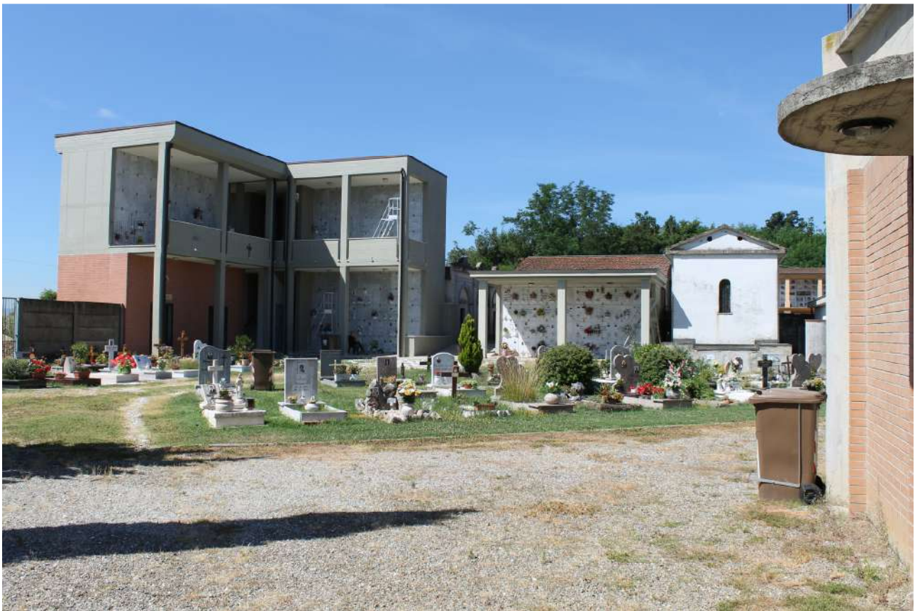
Foto 8: L'interno della parte nuova del cimitero con i loculi del 2011 e il blocco a due piani dell'ampliamento del 2016