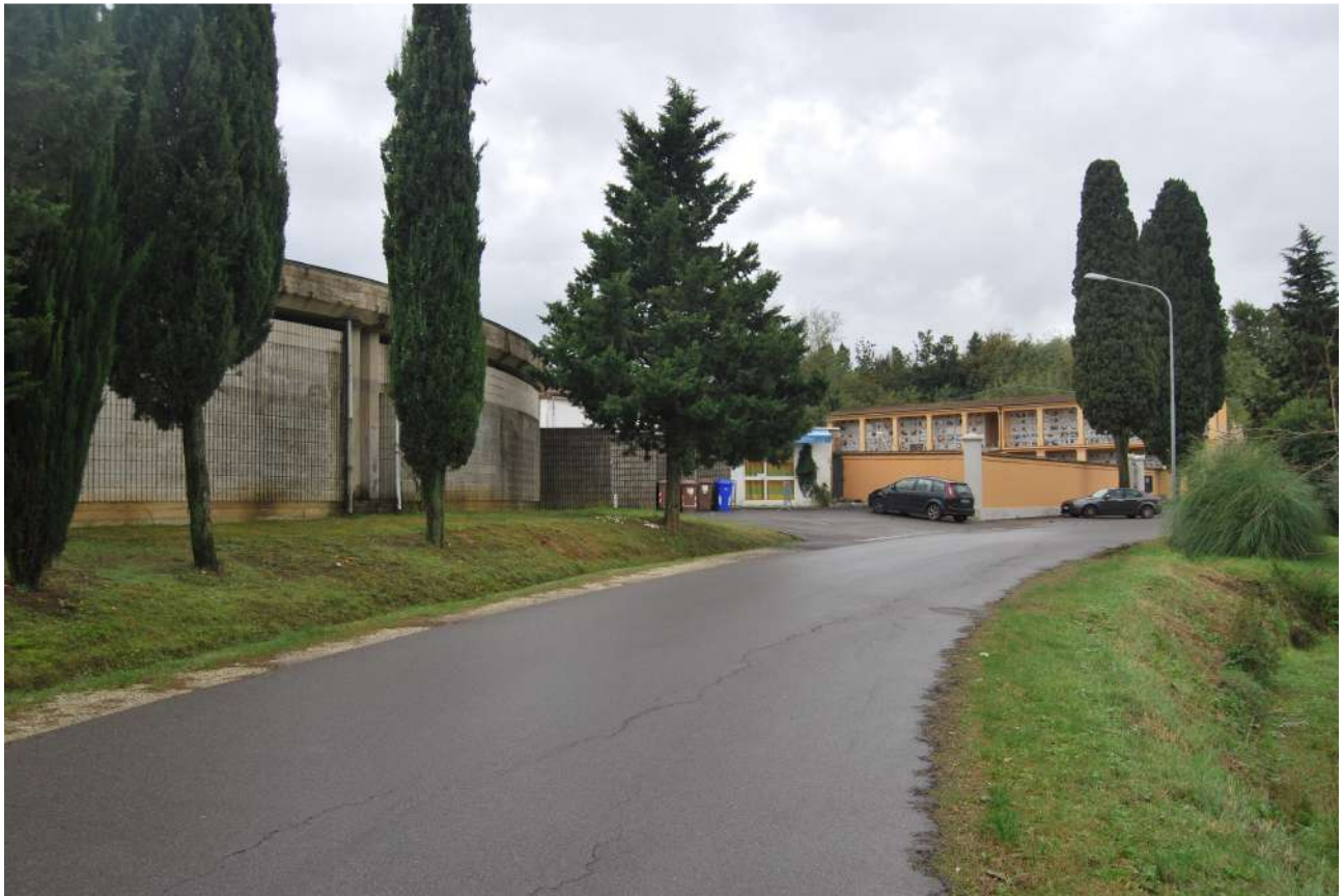
Foto 1: Lo spazio antistante l'ingresso al cimitero, su via del Cimitero