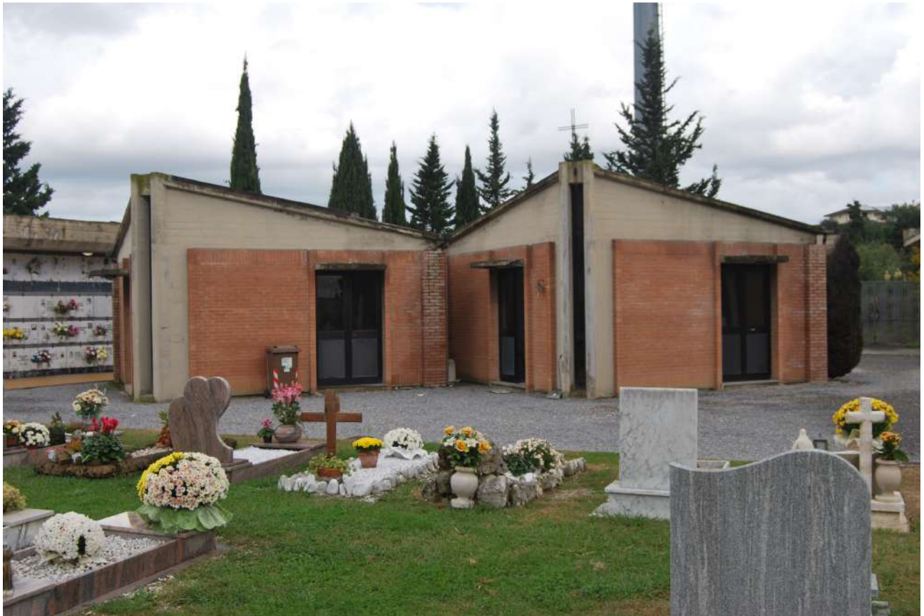
Foto 9: La chiesa e la stanza mortuaria dell'ampliamento del 1985