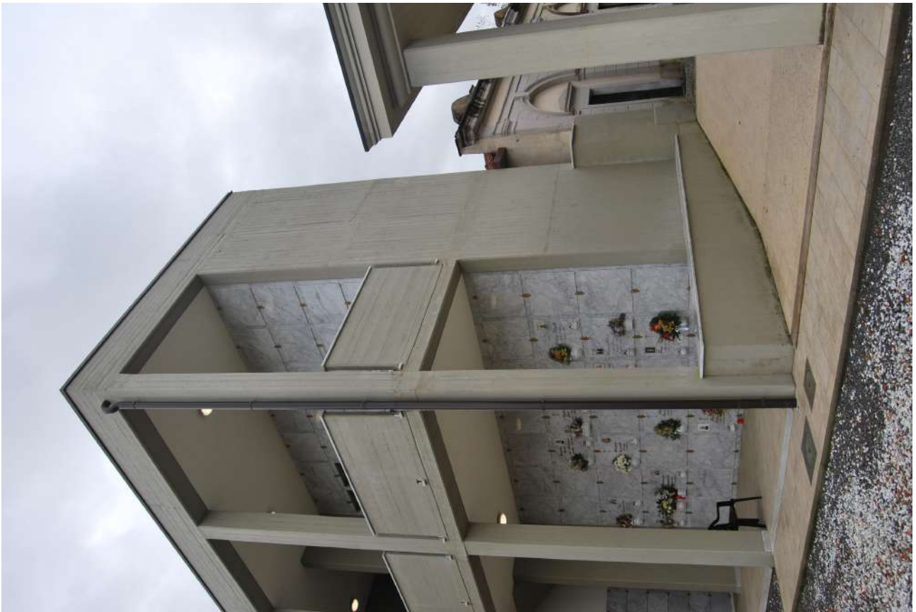
Foto 18: il fronte sud del blocco del 2016 che verrà ridisegnato con il lotto 2