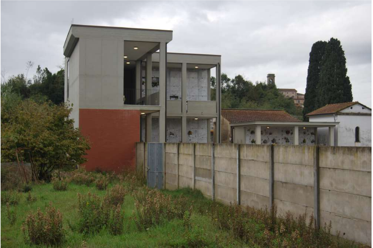
Foto 13: L'attuale recinzione e lo spazio oggetto del futuro ampliamento sul fronte sud